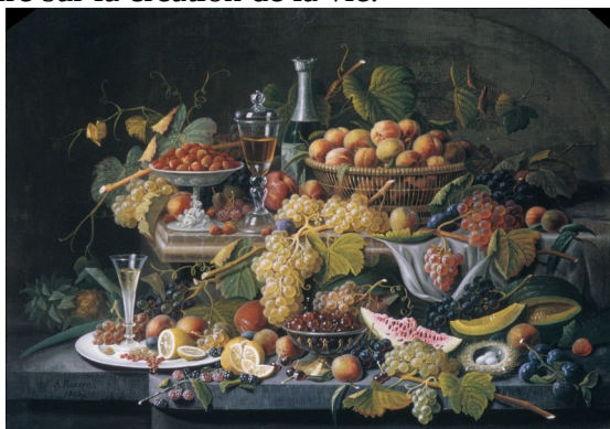
Severin Roesen – Tout ça pour nous !